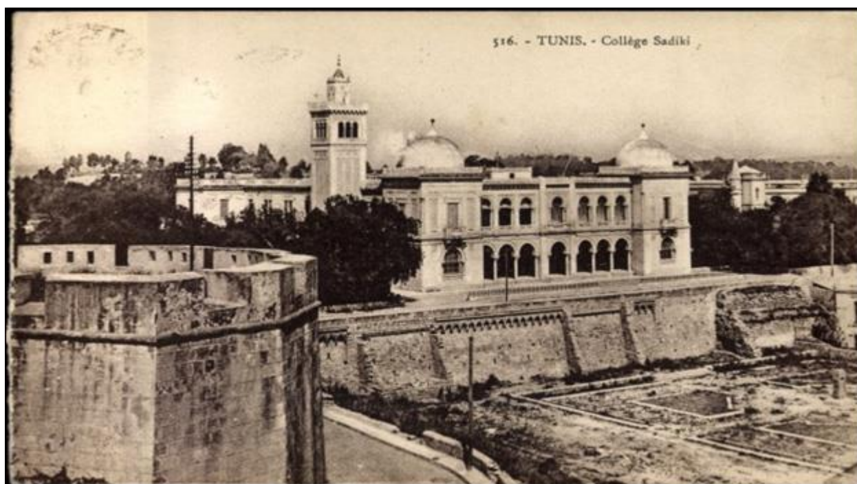
Figura 1 Colegio Sediki, primer colegio tunecino.

lingüísticos que han quedado hasta el siglo XX. Es decir, la lengua española percibe un número considerable e importante en el uso corriente del árabe tunecino. Ahora bien, el español en el sistema educativo tunecino puede realizarse en tres niveles docentes. En la enseñanza media, la primera asignatura de español fue establecida en 1956 en el liceo Sadiqui Jaznadar de Bardo (escuela hermanas de Sion) (Figura 1). Esta escuela fue un ex palacio de Naceur Bey o palacio de la princesa Jeneina luego la Hermana Marie Joanna (congregación de nuestra dama de Sion), lo convirtió en una escuela secundaria para las jovencitas.