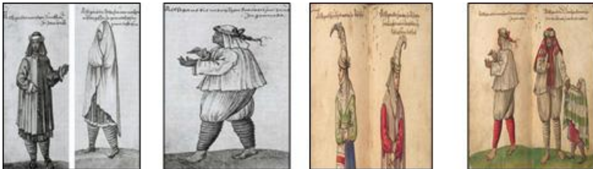
Figura 3. Etiquetas sobre el vestido morisco.